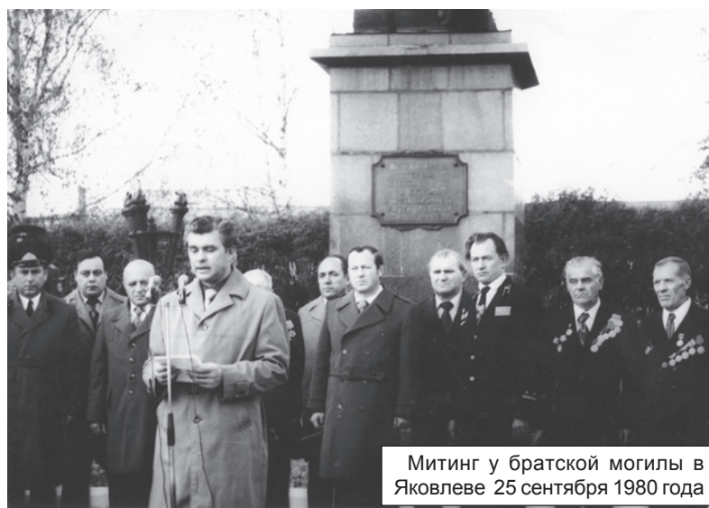
Митинг у братской могилы в Яковлеве 25 сентября 1980 года

16 сентября 1982 года состоялось торжественное открытие мемориала в Яковлеве